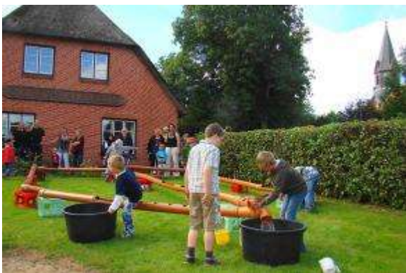
Nach dem Kaffeetrinken gab es spannende Spiele.

"Lasst die Kinder zu mir kommen!", so sagt es Jesus, denn Kinder sind eine Gabe Gottes und wir alle haben eine Verantwortung für unsere Kinder. Mit diesen Worten begann ein fröhlicher Gottesdienst zum 20-jährigen Kindergartenjubiläum. Bei strahlendem Wetter war das anschließende Fest mit vielen aufgebauten Stationen, wie z.B. der „Hüpf-Kirche“, dem Wassermobil, dem Kriechtunnel, sowie der Schminke- und Bastecke ein voller Erfolg für die Großen und Kleinen.