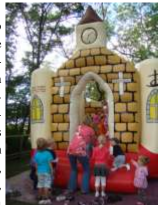
Die Hüpfkirche in Aktion

"Lasst die Kinder zu mir kommen!", so sagt es Jesus, denn Kinder sind eine Gabe Gottes und wir alle haben eine Verantwortung für unsere Kinder. Mit diesen Worten begann ein fröhlicher Gottesdienst zum 20-jährigen Kindergartenjubiläum. Bei strahlendem Wetter war das anschließende Fest mit vielen aufgebauten Stationen, wie z.B. der „Hüpf-Kirche“, dem Wassermobil, dem Kriechtunnel, sowie der Schminke- und Bastecke ein voller Erfolg für die Großen und Kleinen.