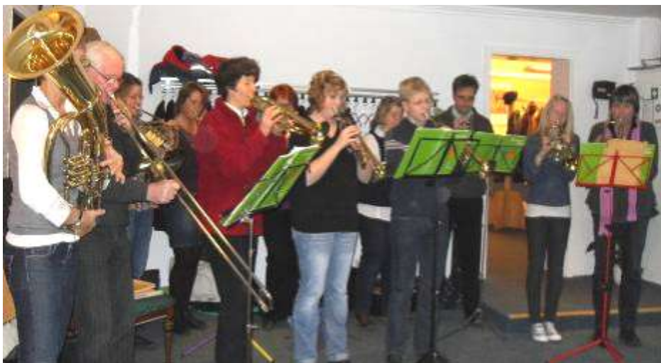
Der Posaunenchor spielte beim Basar Choräle und moderne geistliche Stücke.

Wir danken allen sehr herzlich, die mit viel Einsatz zum Gelingen beigetragen haben.