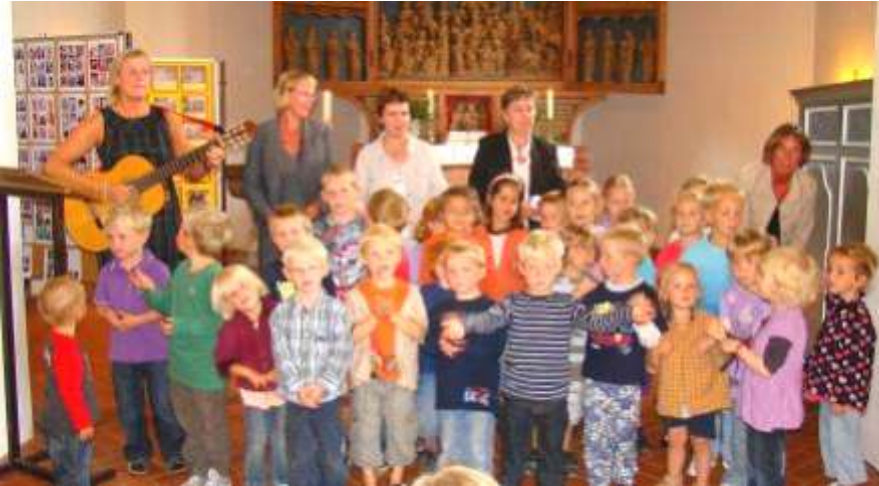
Die Kindergartenkinder singen mit den Erzieherinnen ein Lied im Gottesdienst.

Der Start: Nach vielen Gesprächen und Planungen öffnete 1990 der Odenbüller Kindergarten in dem schönen Reetdachgebäude mit dem wunderbaren Wartfeldgelände seine Türen und hunderte von Kindern haben ihn bisher besucht, um gemeinsam zu lernen, zu spielen, neue Lebensbereiche zu entdecken und Erfahrungen zu sammeln, mehr Selbständigkeit zu entfalten und mit anderen zu teilen. Als kirchlicher Kindergarten leitet uns der Grundsatz: „Mit Gott groß werden“. Hier werden Brücken gebaut, die Erzieherinnen, Eltern, Kinder, Kommunalgemeinde, Schule, Verbände und ökumenisch alle drei Kirchen auf Nordstrand verbindet.