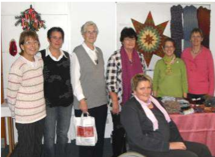
Das Team des Basteltreffs (Auf dem Foto fehlen einige.)

Auch in diesem Jahr lud das Team des Basteltreffs zu einem gemütlichen Nachmittag ins Nommensenhaus ein. Es gab wieder viele kreative bunte Bastel-, Holz- und Handarbeiten, die im Laufe des Jahres immer am ersten Dienstag im Monat im Nommensenhaus vorbereitet worden waren. Die Mühe hat sich gelohnt. Es kamen sehr viele Besucher, die etwas für sich fanden.